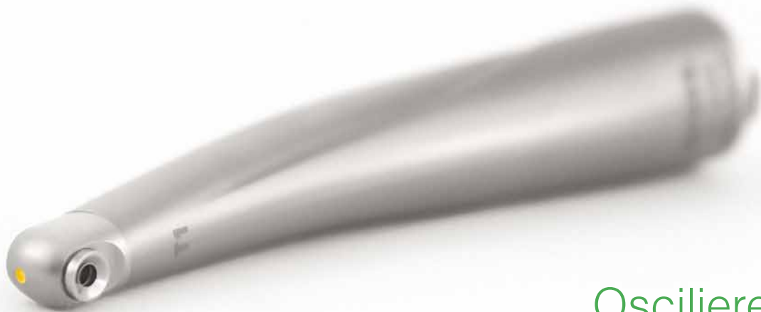
Oscilierendes EVA Winkelstück